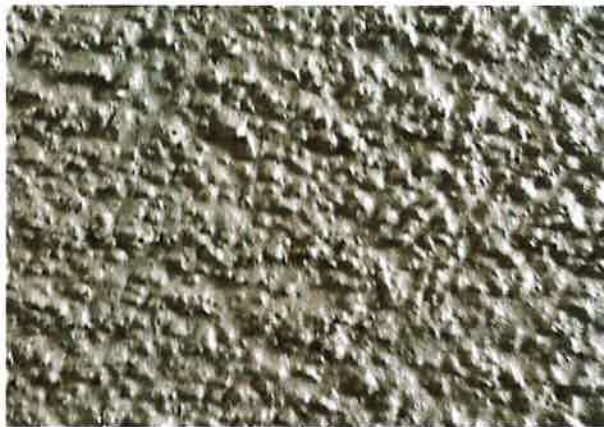
[그림3] 완충재 E-콘