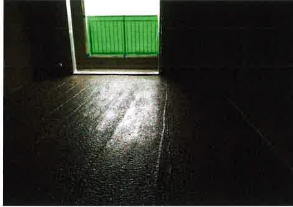
(b) E-콘 타설 후