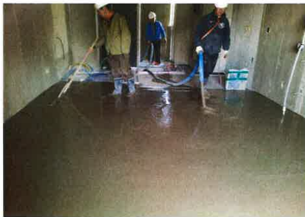
(d) 마감모르터 시공