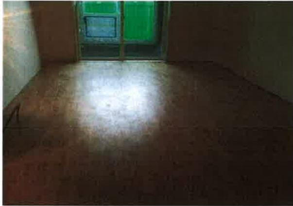
(f) PVC계 바닥재 시공 후