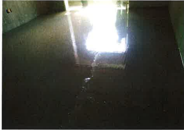
(e) 마감모르터 시공 후