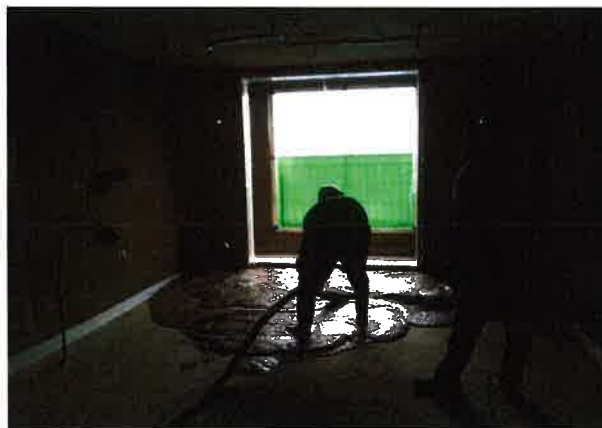
(a) E-콘 타설